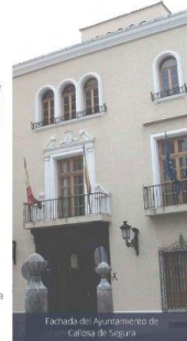
Fachada del Ayuntamiento de Callosa de Segura