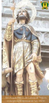
San Roque, Patrono de Callosa del Segura, en la Iglesia Arzobispal de San Martín.