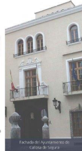
Fachada del Ayuntamiento de Callosa de Segura