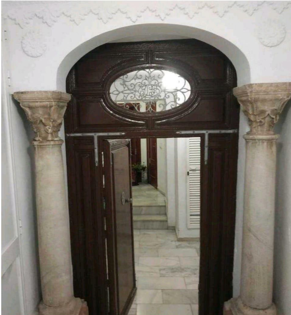
Portal - escaleras