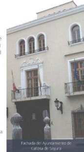
Fachada del Ayuntamiento de Callosa de Segura