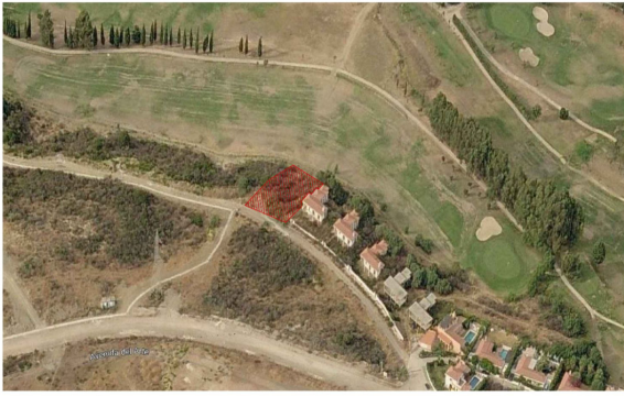
ORTOFOTO VISTA DE PAJARO