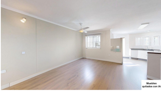
Muebles quitados con IA