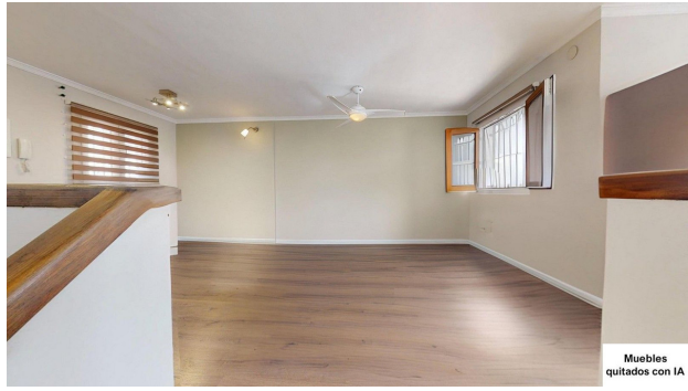
Muebles quitados con IA