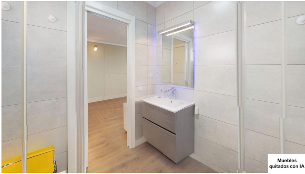
Muebles quitados con IA