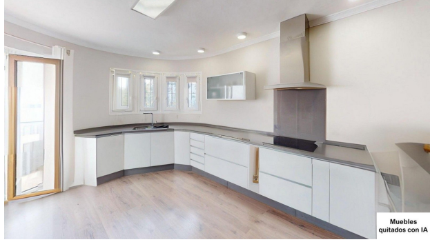
Muebles quitados con IA