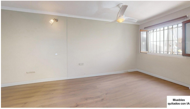
Muebles quitados con IA