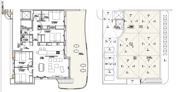
bloque 2 ordenacion general