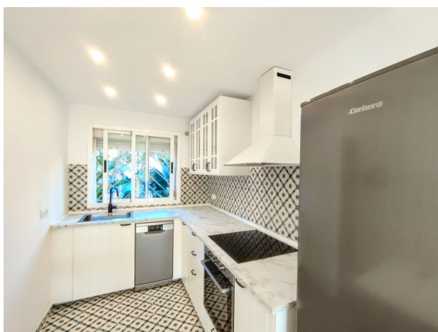
Decoración virtual - Virtual Deco