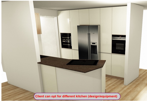
Client can opt for different kitchen (design/equipment)