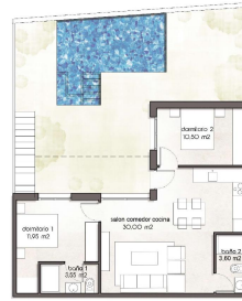
PB / GROUND FL.