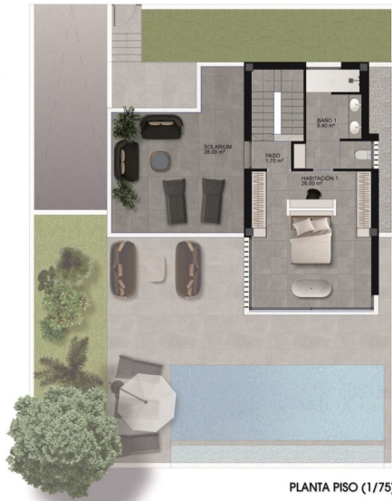
PLANTA PISO (1/75)