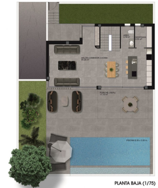
PLANTA BAJA (1/75)