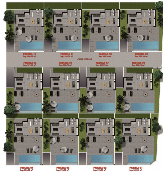
PLANTA BAJA GENERAL (1/250)