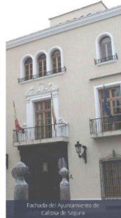
Fachada del Ayuntamiento de Callosa de Segura