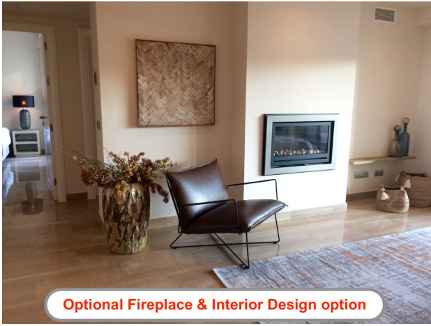
Optional Fireplace & Interior Design option