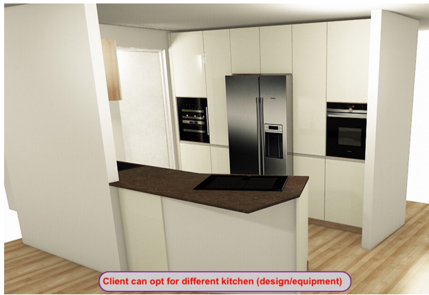
Client can opt for different kitchen (design/equipment)