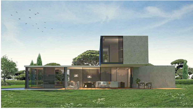
48.00 m 2 construido