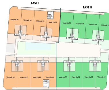
ISO A3 - Escala 1:250