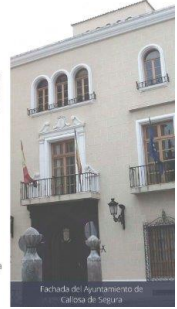
Fachada del Ayuntamiento de Callosa de Segura