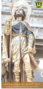
San Roque Patrono de Callosa del Segura, en la Iglesia Arzobispal de San Martín